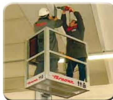
Cestello per 2 operatori